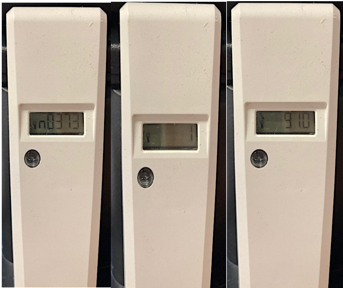
ITN – číslo přístroje

Pokud provádíte samoodečet pro vyúčtování služeb opisujte tuto hodnotu.